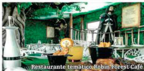
Restaurante temático Robin Forest Café