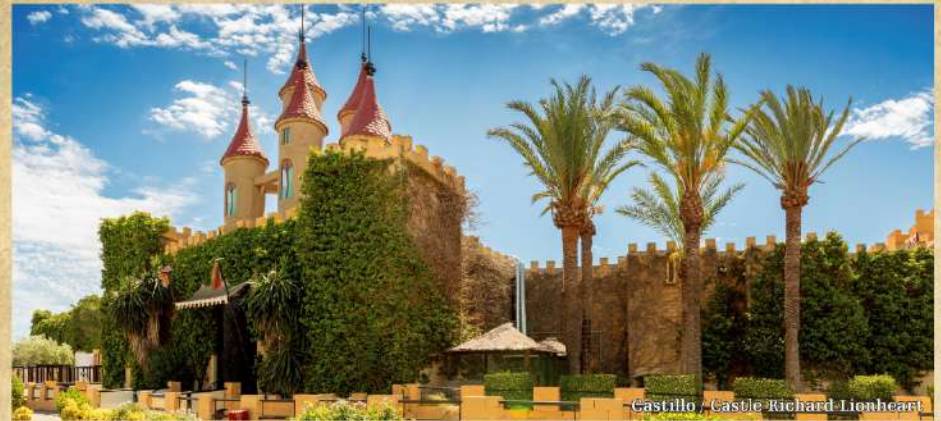
Castillo / Castle Richard Lionheart

SPECIAL POOL PROGRAMME 2022. The Management has a system in place, sunbeds are numbered and reserved during the time of their use. For the pool, the clients will be able to use the special Magic pool towels at the entrance of the main pool or any of Robin's two pools. The payment of a deposit of 15€ is required, which will be returned to you on departure when you return the towel. The towel will be at your disposal during your entire stay. The towels will be changed daily at the pool Guest Service point.