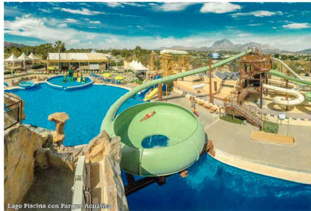
Lago Piscina con Parque Acuático