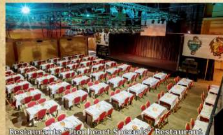
Restaurante "Lionheart Specials" Restaurant

MAGIC GIVES YOU MUCH MORE... YOU'LL BE SURPRISED!