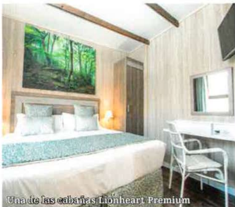
Una de las cabañas Lionheart Premium