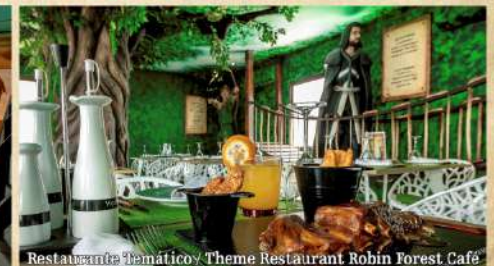
Restaurante Temático / Theme Restaurant Robin Forest Café

PRIMERAS MARCAS INTERNACIONALES EN TODOS LOS BUFFETS Y BARES PARA PULSERAS VÁLIDAS* Garantizamos la autenticidad de las marcas de nuestros proveedores ante Notario.